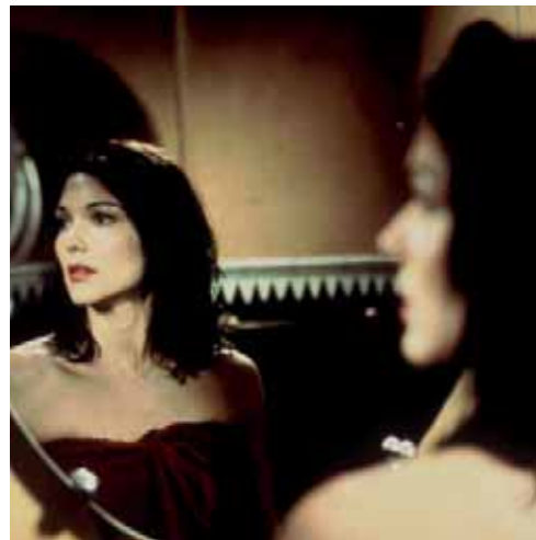
David Lynch Mulholland Drive