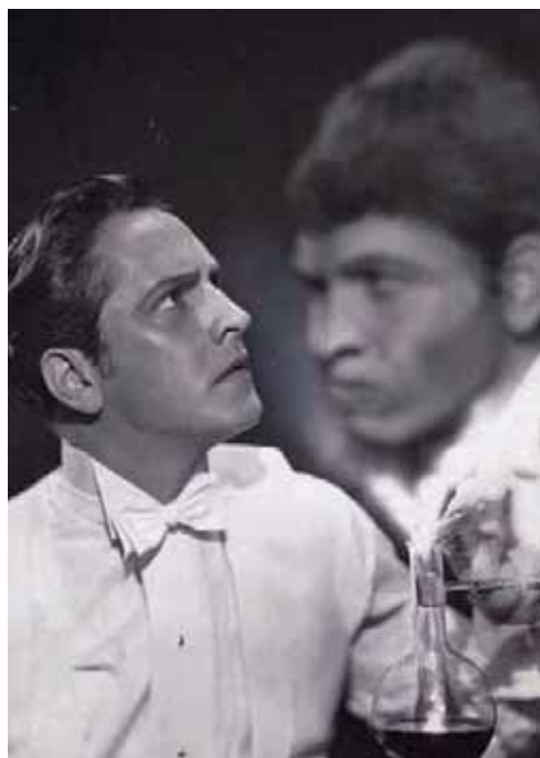
Rouben Mamoulian Il dottor Jekyll / Dr. Jekyll and Mr. Hyde