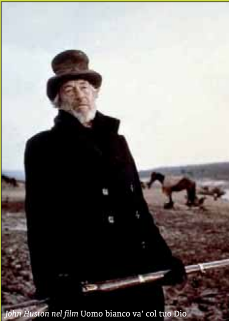
John Huston nel film Uomo bianco va' col tuo Dio

Trentotto film da regista, una quindicina (a parte i suoi) come sceneggiatore, molti ma molti di più come interprete, in quei ruoli da caratterista, spesso cattivo, talvolta eccentrico, sempre imponente che si spartiva con un altro autore suo contemporaneo e amico, Orson Welles, come lui sempre a caccia di ingaggi per finanziare i propri film o per mantenere il proprio tenore di vita. John Huston: un grande classico che è diventato, negli anni Settanta e Ottanta, un grande contemporaneo, agganciando lo spirito dissacrante del "nuovo cinema americano" con un'impressionante giovinezza di idee e di stile. È ovvio che la 28ª edizione del Torino Film Festival sia innanzitutto all'insegna di John Huston che, dal primo noir della storia del cinema ( Il mistero del falco , del 1941, tratto da Dashiell Hammett e interpretato da Humphrey Bogart) ai due ultimi film diretti nel 1985 e nel 1987 ( L'onore dei Prizzi , acidissima revisione del genere e sotterranea parodia del Padrino di Coppola, e The Dead , il capolavoro ispirato a un racconto di Gente di Dublino di James Joyce), non si è mai stancato di vivere nuove avventure cinematografiche, al fianco dei maggiori divi di tre generazioni hollywoodiane. Al Torino Film