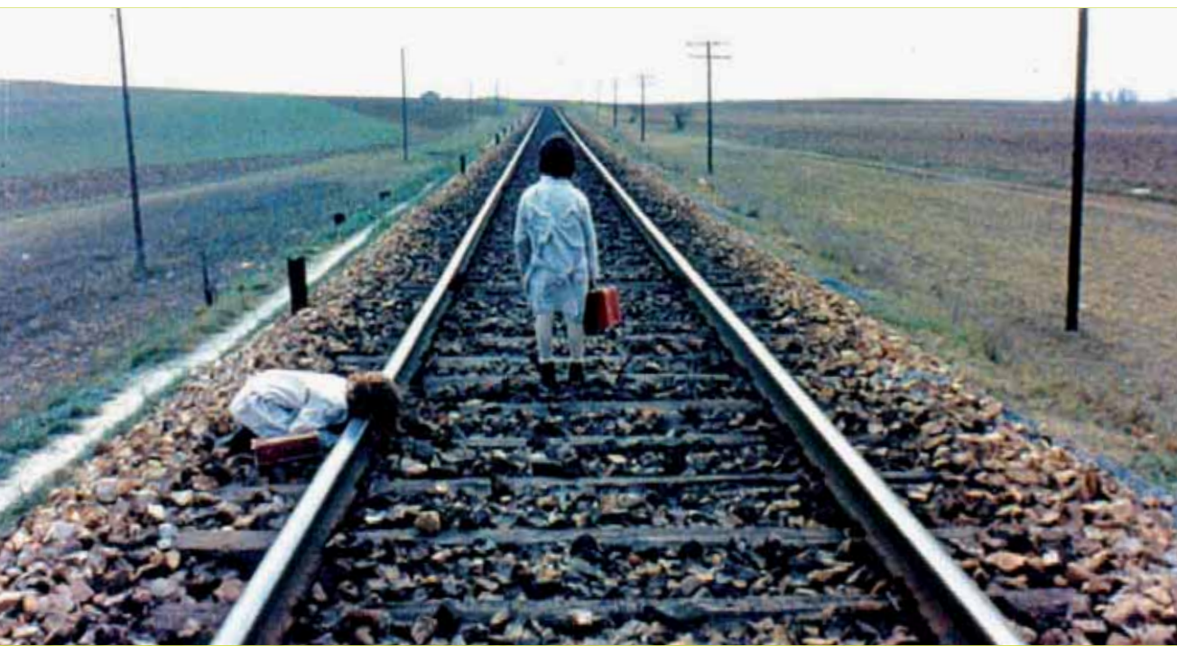
Lo spirito dell'alveare (1973)

Il sogno della luce Il cinema di Víctor Erice